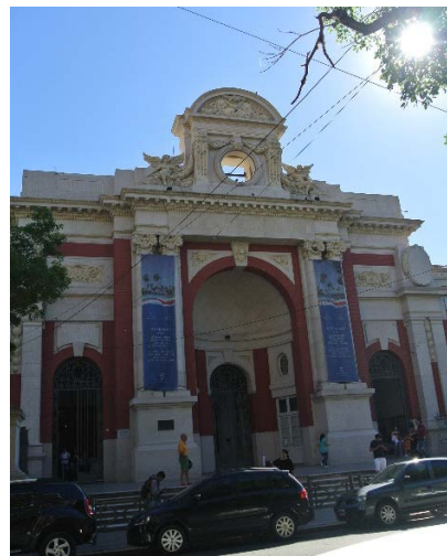
4) Escuela Del Centenario