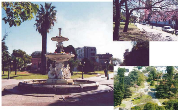
Plaza Alvear (Plaza de los Museos) – en su perímetro se encuentra la Iglesia San Miguel y el Museo de Bellas Artes.