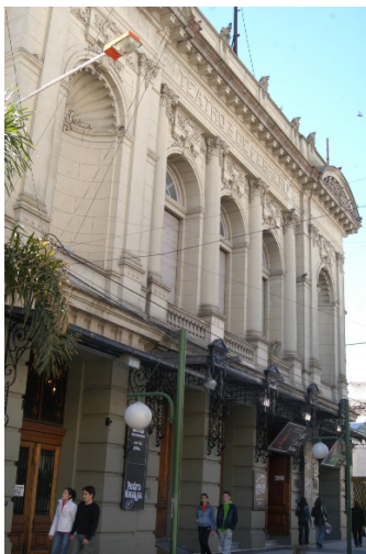
3) Teatro 3 de Febrero