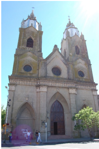
1) Iglesia San Miguel