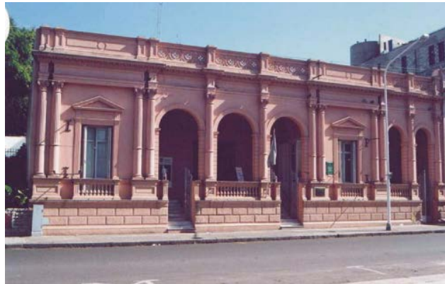
2) Museo de Bellas Artes