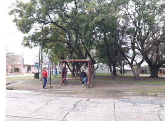
Plaza Belgrano - VC