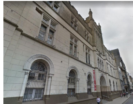
Fac. de Humanidades y Artes