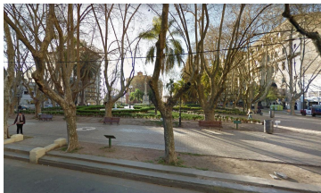
Plaza 25 de Mayo