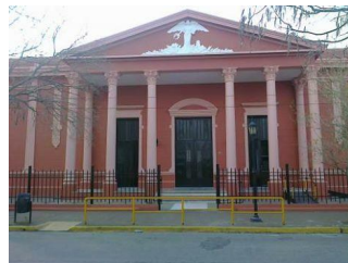
Colegio San Carlos - SL